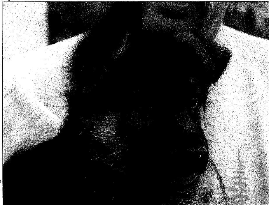
Elevage de la Bédrie

Pour ma part, je trouve qu'un Berger Allemand ne doit pas seulement être beau, mais également avoir du tempérament,